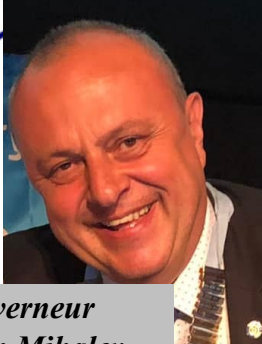
Gouverneur Plamen Mihalev